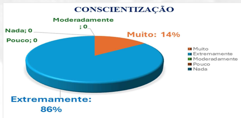
Gráfico 03: Importância da conscientização no trânsito

Os resultados reforçam essa carência que temos de campanhas de conscientização no trânsito, estimulando a incentivar que políticas para essa questão sejam melhoradas. Pois, quando analisamos o conhecimento dos entrevistados em relação a leis de trânsito e penalidades associadas a infrações, apenas menos da metade com 43% afirmaram que conhecem bem. Com 31% assumiram que conhecem as principais, 24% têm pouco conhecimento e apenas 2% não obtêm nenhum conhecimento sobre o assunto.