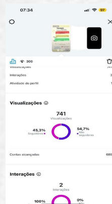
Figura 8