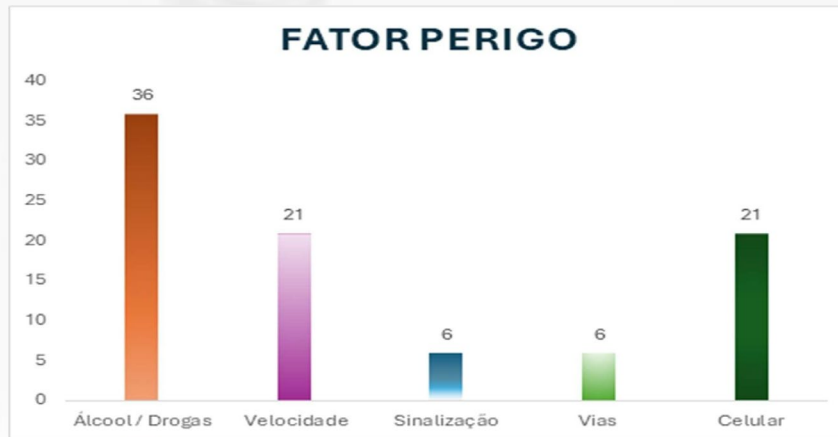
Figura 5 - Fonte: Própria, 2024.

Em relação à importância da conscientização sobre segurança no trânsito, 86% acreditam que é extremamente importante, 14% muito e para as opções de moderadamente, nada e pouco importantes ninguém marcou (Gráfico 03).